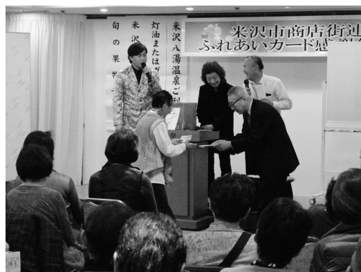
令和元年度ふれあいカード感謝祭の様子